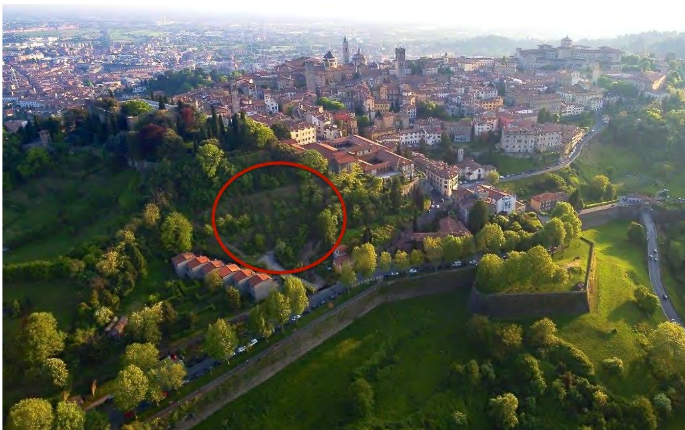
contesto di inserimento

Proprio all'interno della cinta muraria tutelata di Bergamo, a ridosso della stessa, sono partiti i lavori per la costruzione di un parcheggio multipiano, destinato prevalentemente alla sosta turistica a rotazione, la cui struttura, 9 piani per 469 auto, occuperà gli spazi di buona parte del Parco della Rocca medioevale che domina la città (ex parco faunistico), in via Fara, nel tratto di mura compreso fra le porte Garibaldi e Sant'Agostino [ALL.1].