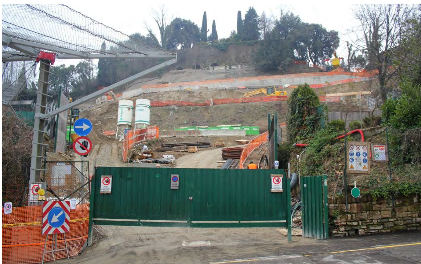
Il cantiere oggi: si notino i lavori di consolidamento alla base delle mura esterne della Rocca

Il trasporto del materiale inquinato, tramite teleferica, è iniziato da poco tempo, e si protrarrà per diverse settimane, prima di poter procedere con ulteriori scavi e la successiva edificazione del parcheggio.